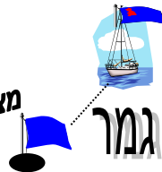
מצוף דגל כחול